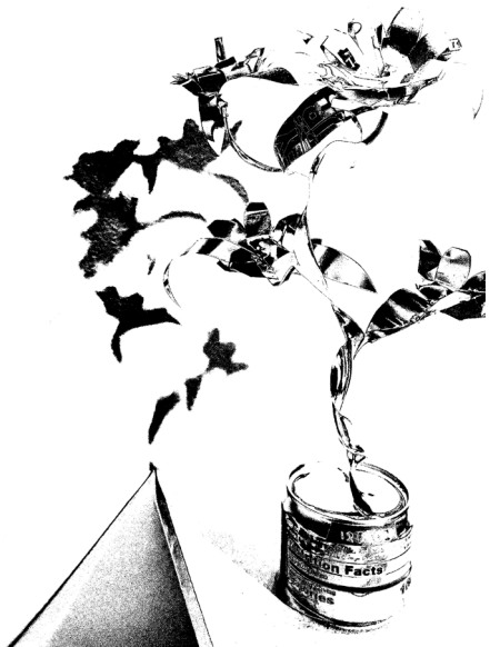
堅尼街研究會，《易拉罐花》，2026