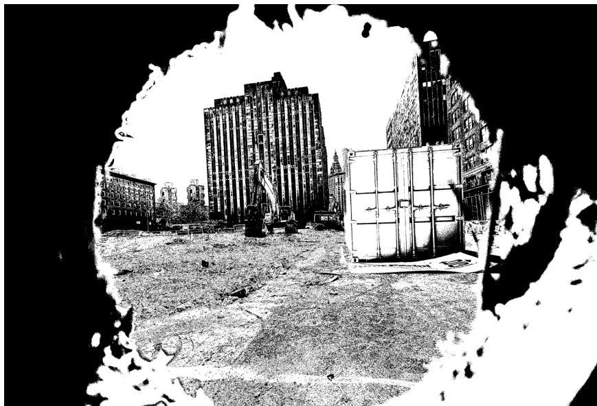
保羅·菲弗，《視角研究》，2026 把獲加街124-125號建築工地作為參考視角