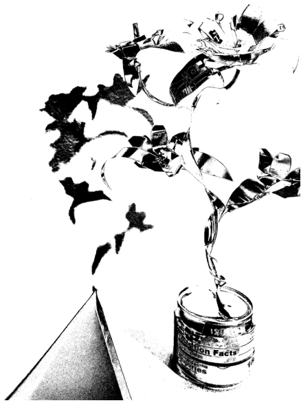
堅尼街研究會，《易拉罐花》，2026