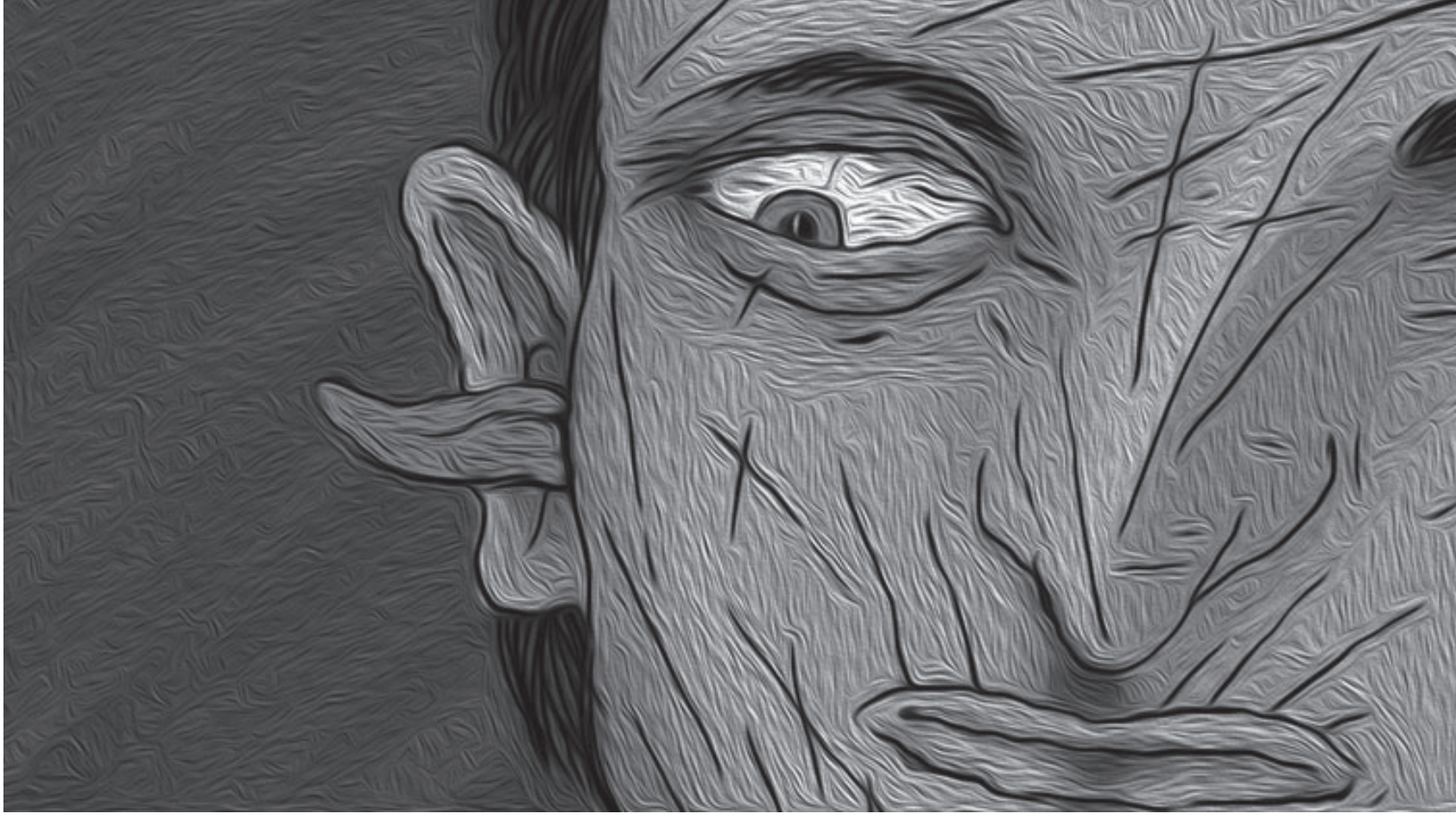
“Banal” isimli videodan, 2014.

NİLÜFER ŞAŞMAZER nilufer@istanbulartnews.com