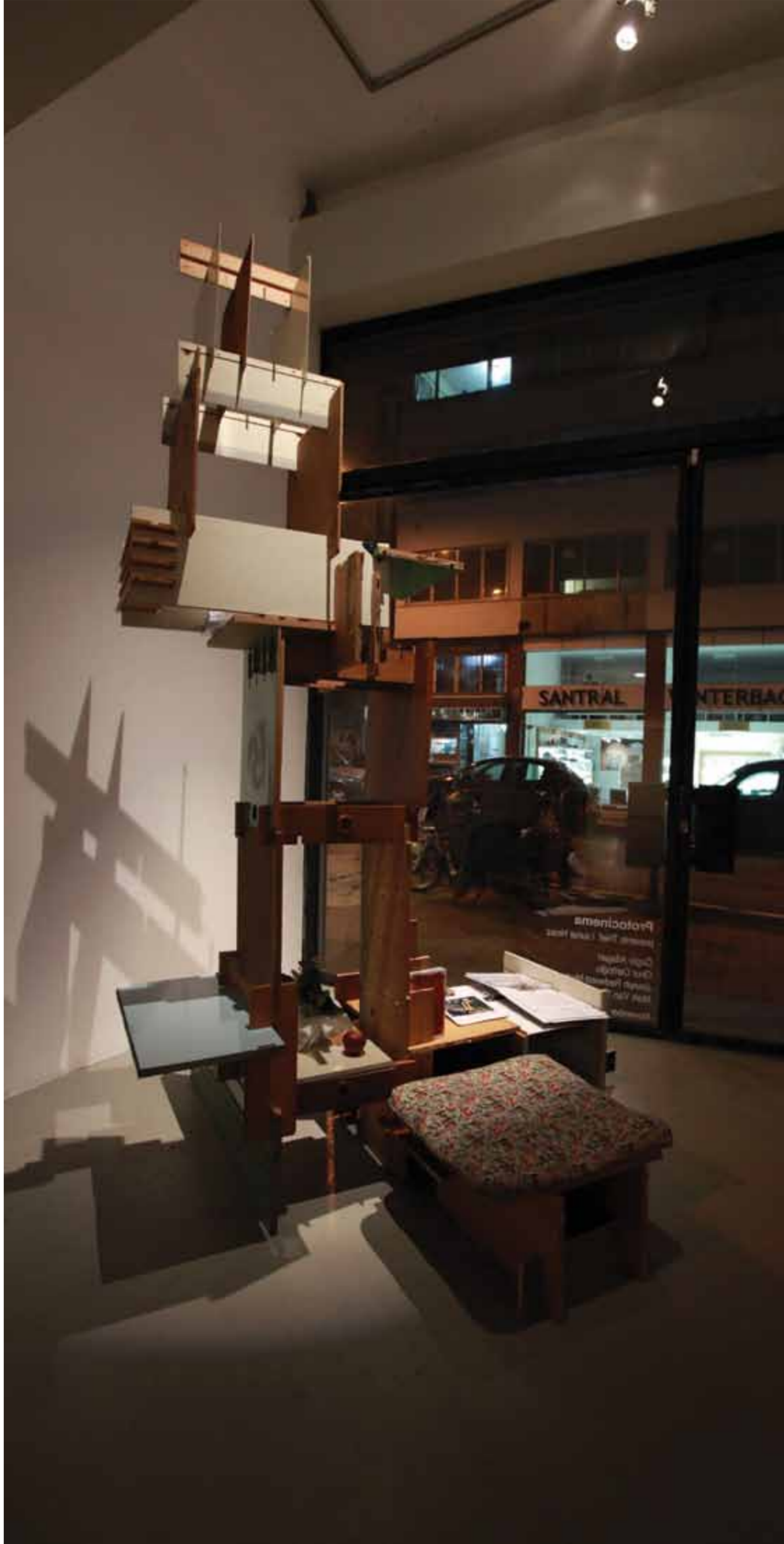
The Gods of the Sunken Ship, 2011