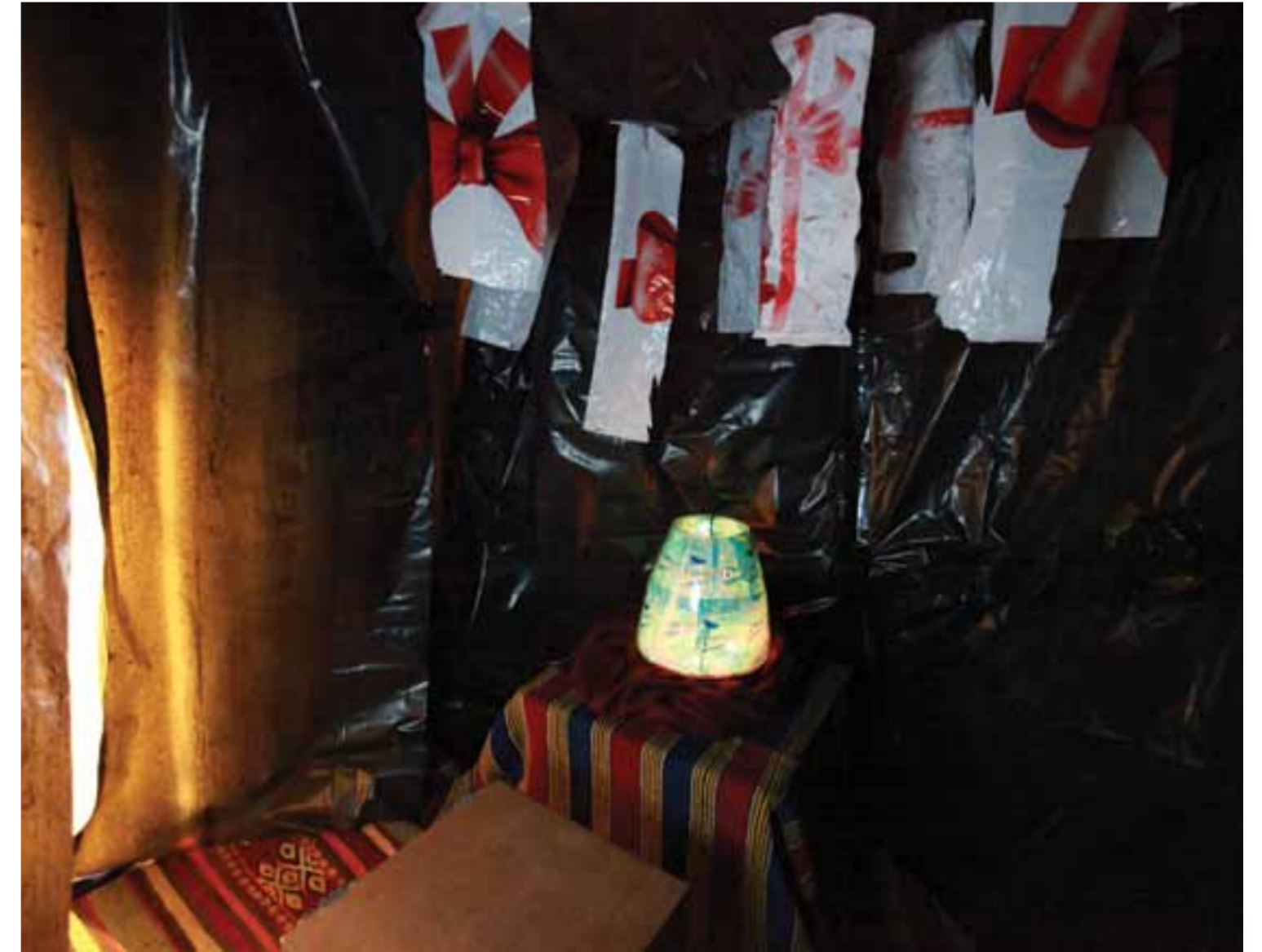
"The Goods of the Sunken Ship", 2011.