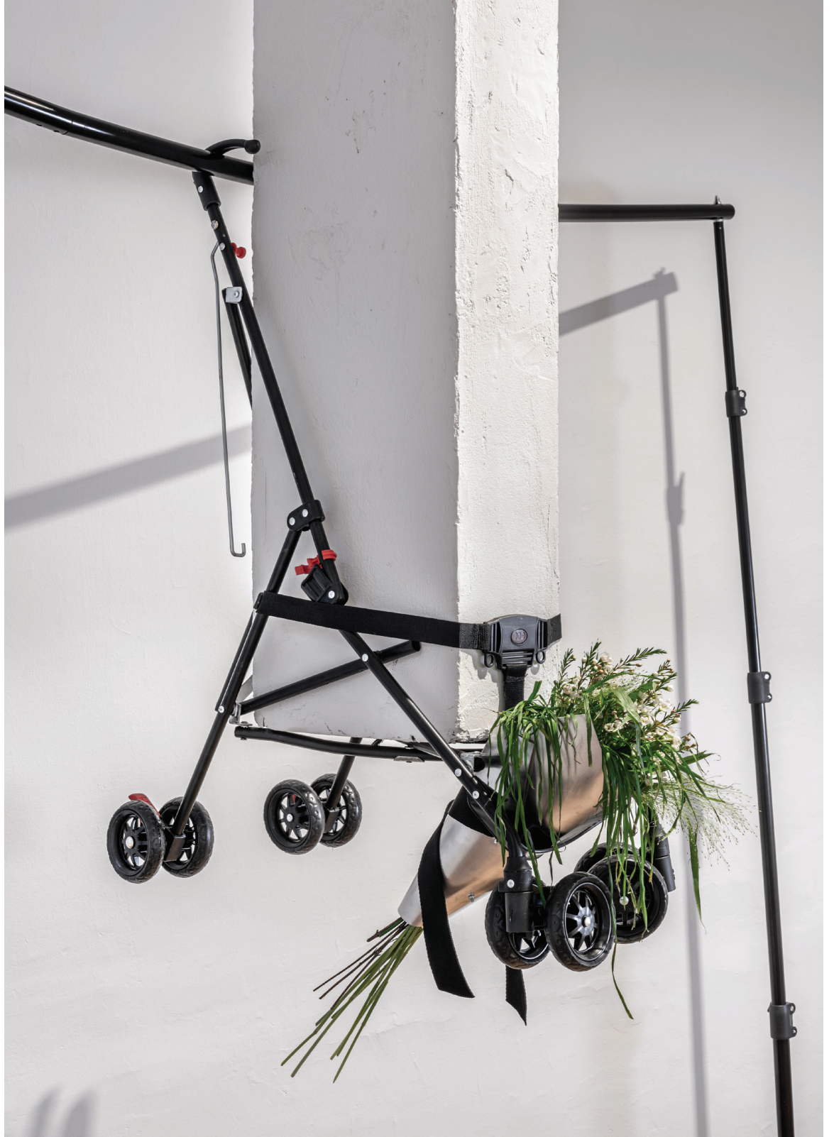
Baha Görkem Yalım Bulunmamışlara Anıt, 2021 Foto: Zeynep Fırat